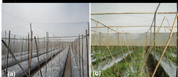
(a). Penggunaan Shading Net APBN-P 2011 Diijen Horti di Kelompok Tani Gembira Tani IV, Kecamatan Gandasari, Kab. Blitar, Jawa Timur (Penyusunan Shading Net sebelum Cabai ditanam); (b). Penggunaan Shading Net APBN-P 2011 Diijen Horti di Kelompok Tani Sri Lestari, Desa Pasirian, Kecamatan Pasirian, Kab. Lumajang, Jawa Timur (Pemasangan Shading Net setelah Cabai ditanam)