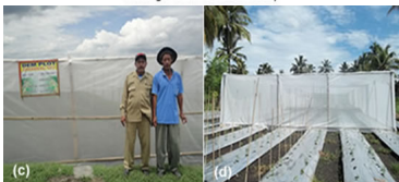
(c). Shading Net APBN-P 2011 Diijen Horti yang digunakan pada pertanaman Cabai Kelompok Tani Sri Lestari, Desa Senganten, Kecamatan Gondang, Kab. Bojonegoro Jawa Timur; (d). Shading Net APBN-P 2011 Diijen Horti yang digunakan pada pertanaman Cabai Kelompok Tani Tulus Karya, Desa Bades, Kecamatan Pasirian, Kab. Lumajang, Jawa Timur