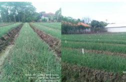
1) dan 2) Lahan Pertanian Bawang Merah Organik Kelompok Tani Bahagia IV, Desa Banjaratma, Kecamatan Bulakamba, Kabupaten Brebes