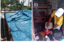
1) dan 2) Rumah Kompos dan Pusat Pengembangan Agens Hayati (Puspahati) Kelompok Tani "Tani Makmur", Desa Sisalam, Kecamatan Wanayasa, Kabupaten Brebes

Wednesday, 21 August 2019 23:52 - Last Updated Thursday, 22 August 2019 00:03