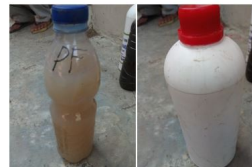
1) dan 2) Agens Hayati Pseudomonas fluorescens dan Metabolit Sekunder (MS) Trichoderma produksi Pusat Pengembangan Agens Hayati (Puspahati) Kelompok Tani "Tani Makmur", Desa Sisalam, Kecamatan Wanayasa, Kabupaten Brebes.