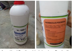
Agens Hayati Paenibamak berbahan dasar Paenibacillus polymixa produksi Pusat Pengembangan Agens Hayati (Puspahati) Kelompok Tani "Tani Makmur", Desa Sisalam, Kecamatan Wanayasa, Kabupaten Brebes.