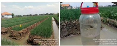
1) Lahan Pertanaman Bawang Merah Organik di KT “Tani Makmur”; 2) Perangkap Feromon Seks untuk mengendalikan hama ulat bawang Spodoptera exigua di lahan pertanaman bawang merah organik Kelompok Tani “Tani Makmur”, Desa Sisalam, Kecamatan Wanasari, Kabupaten Brebes

DPO bidang hortikultura di Kabupaten Brebes dalam proses selanjutnya akan dilakukan proses sertifikasi. DPO akan disertifikasi jika dinyatakan telah menerapkan sistem pertanian organik, menyelesaikan masa konversi dan menerapkan Sistem Kendali Internal (SKI). Sistem Pertanian Organik yang dijalankan DPO dapat meningkatkan dan mengembangkan kesehatan agroekosistem, termasuk keragaman hayati, siklus biologi, dan aktivitas biologi tanah. SKI adalah merupakan sistem penjaminan mutu yang terdokumentasi, yang memperkenankan lembaga sertifikasi mendelegasikan inspeksi tahunan semua anggota kelompok secara individual kepada lembaga/unit dari operator yang akan atau telah disertifikasi. Pendampingan secara intensif oleh Petugas Pengendali OPT (POPT) di Kecamatan Bulakamba dan Wanasari Kabupaten Brebes, Petugas LPHP Pemalang, UPTD BPTPH Provinsi Jawa Tengah dan Direktorat Perlindungan Hortikultura sangat diperlukan dalam proses menuju sertifikasi Desa Pertanian Organik (DPO) bidang hortikultura di Kelompok Tani “Tani Makmur” dan Kelompok Tani “Bahagia IV” di Kabupaten Brebes.