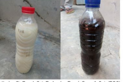
1) dan 2) Pupuk Cair Prabu dan Pupuk Organik Cair (POC) produksi Pusat Pengembangan Agens Hayati (Puspahati) Kelompok Tani "Tani Makmur", Desa Sisalam, Kecamatan Wanayasa, Kabupaten Brebes.