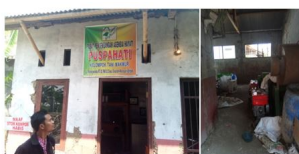
1) dan 2) Pusat Pengembangan Agens Hayati (Puspahati) Kelompok Tani “Tani Makmur”, Desa Sisalam, Kecamatan Wanasari, Kabupaten Brebes