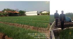
1) dan 2) Lahan Pertanian Bawang Merah Organik Kelompok Tani Bahagia IV, Desa Banjaratma, Kecamatan Bulakamba, Kabupaten Brebes